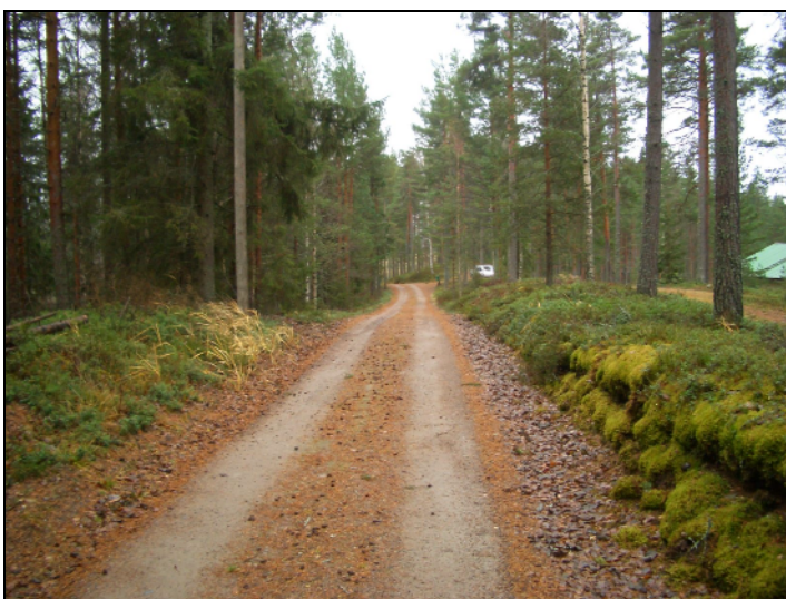
Asuinpaikan pohjoispäästä etelään. Kohdalla tie nousee lakitasanteen laelle ja leikkaa sitä. Asuinpaikka jää oikealle.