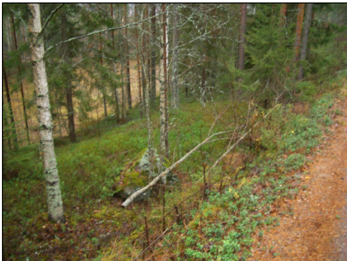
Tien itäreunaa asuinpaikan keskikohdalla. Pengerrystä kapean alemman terassin päällä.