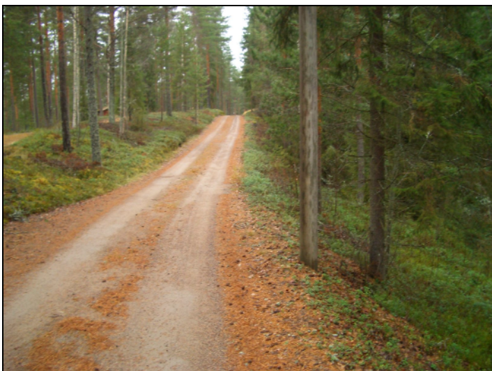
Kuvattu pohjoiseen. Uudempi tie ja sen itäpenger. Asuinpaikka vasemmalla näkyvän ylemmän lakiterassin päällä. Kuvattu huvilalle menevän tien risteysen tasalta.